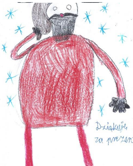
Wiktor Cioch kl. III