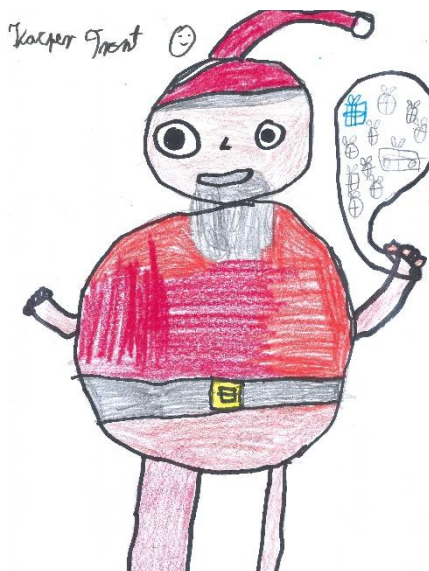
Karol Tront kl. III