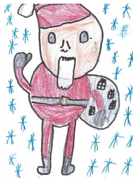
Filip Cioch kl. I